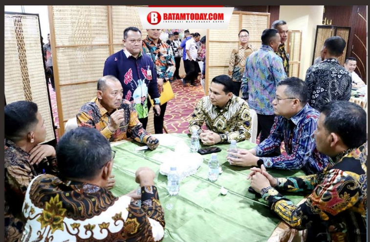
Masing-masing pemegang saham Bank Riau Kepri Syariah saat rapat