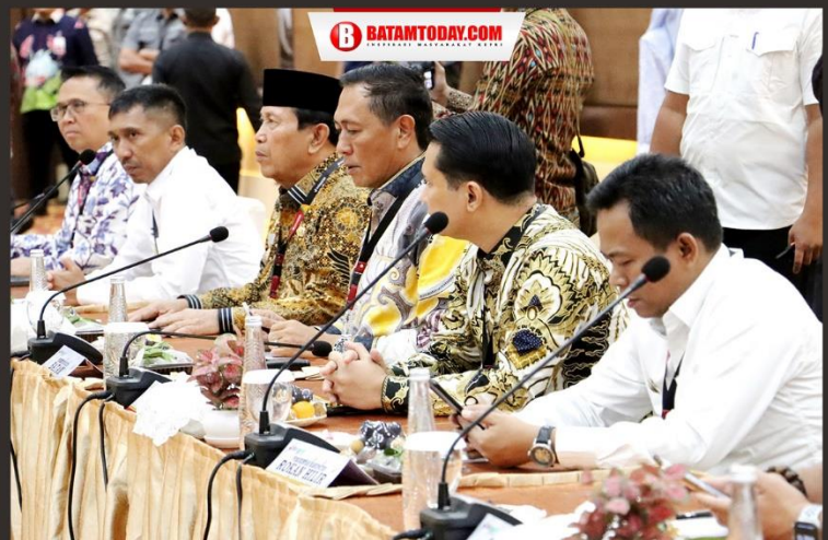
Bupati Bintan dan perwakilan kepala daerah saat menyimak rapat pemegang saham BRK Syariah