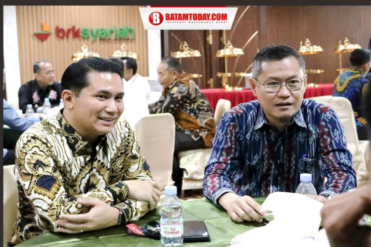
Plt Bupati Bintan saat menyimak perbincangan dengan pemegang saham BRK Syariah