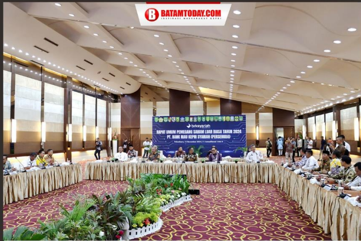
Suasana saat rapat pemegang saham BRK Syariah di Pekanbaru, Riau