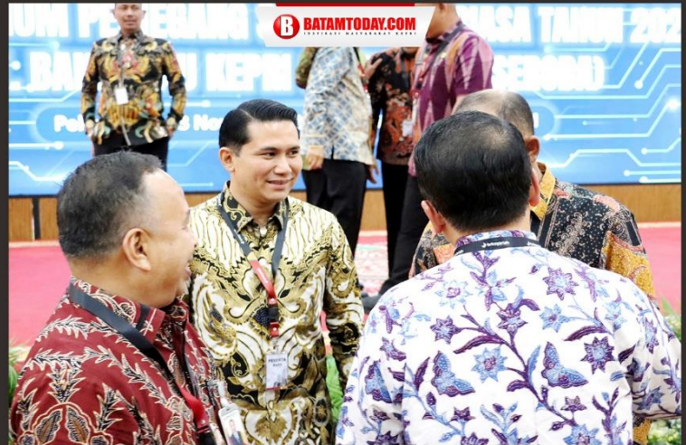
Plt Bupati Bintan saat berbincang dengan pemegang saham BRK Syariah lainnya